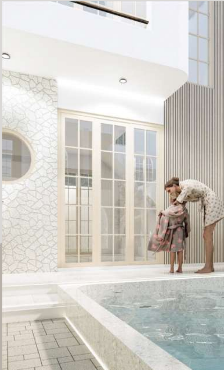
D'VIONA VILLA JOGJA