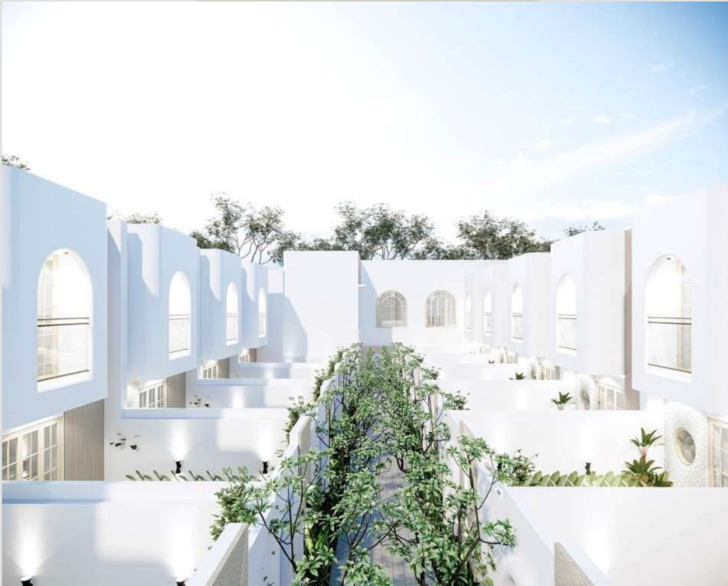
D'VIONA VILLA JOGJA