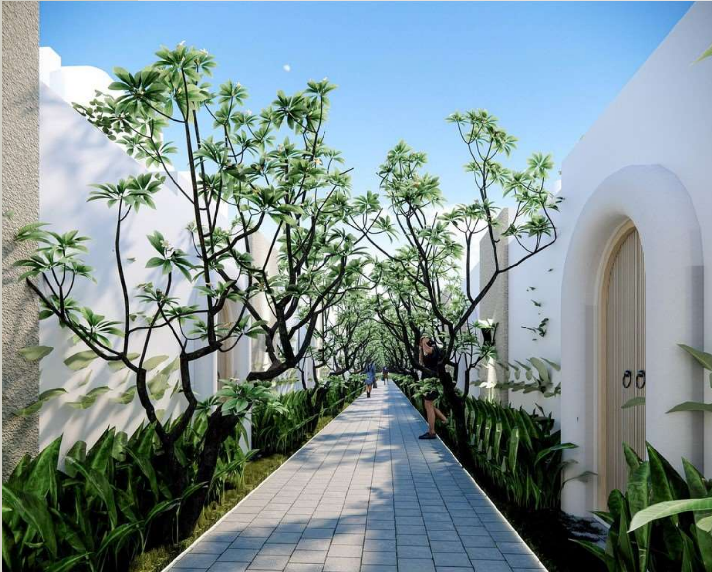
D'VIONA VILLA JOGJA